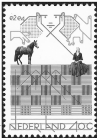
Eerste Nederlandse "schaak"-postzegel. (1978.)